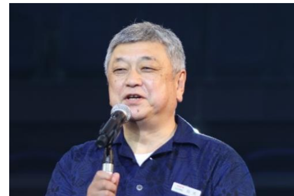
コプロ株式会社 代表取締役社長

スーパーマーケットは地域の生活者にとって欠かせない社会的インフラとして重要な役割があります。当社は使命である「AJS会員企業の繁栄に貢献する」を実現し、地域の生活者を支えるAJS会員企業をバックアップしていきたいと考えています。